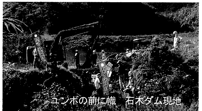
クレーンの前に職 石木ダム現地